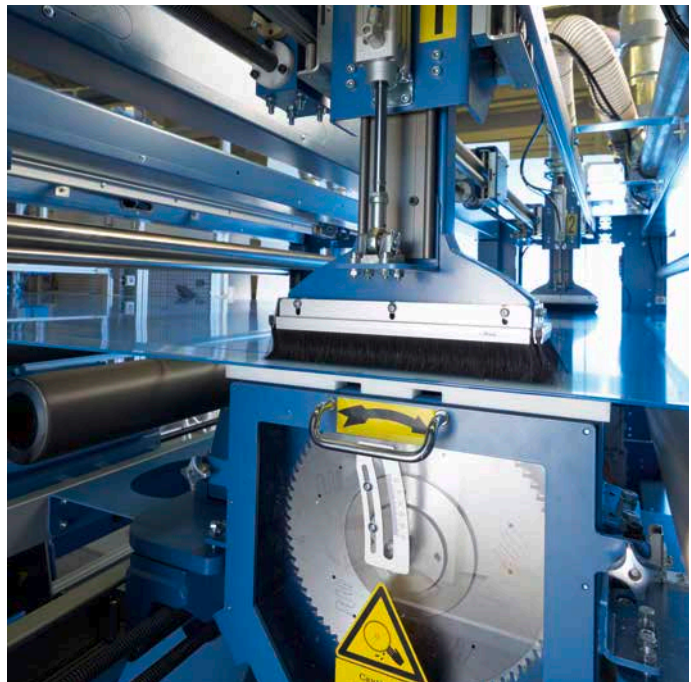
Gute Zugänglichkeit für sicheren Sägeblattwechsel